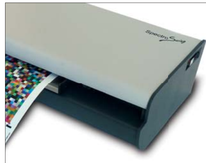
Einfachste Anwendung Dank "No Button Operation"