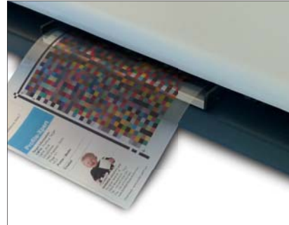
Zur Erstellung echter Durchlichtprofile für transparente Materialien (Spectro Swing RT)